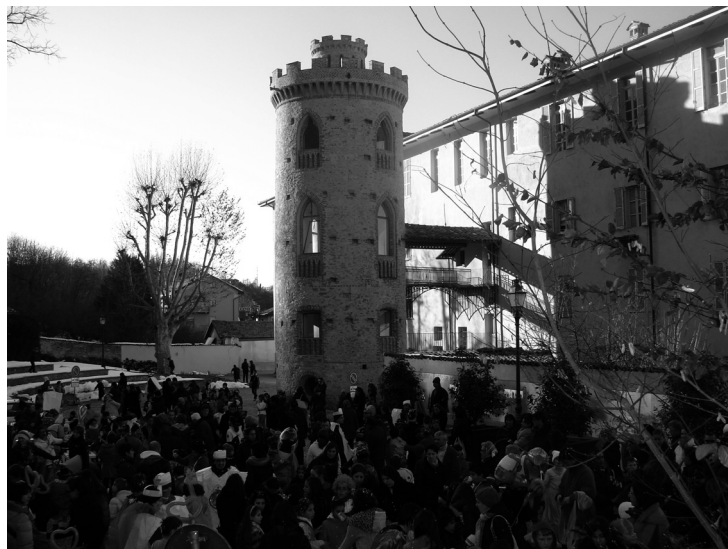
Sabato 9 febbraio: gran carnevale dei bambini e dei ragazzi. Numerosa la partecipazione, anche di adulti (vedi foto).