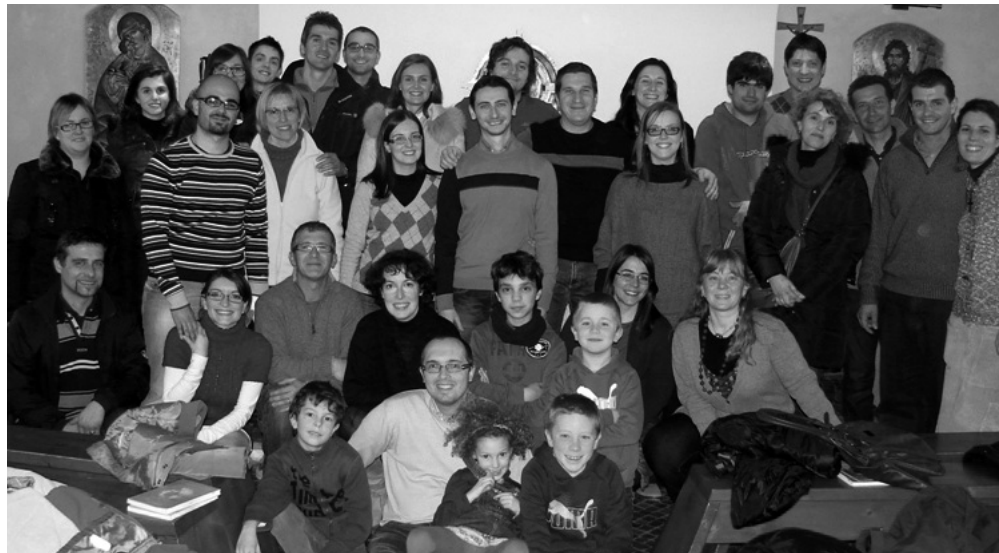
Il gruppo di fidanzati con gli animatori nella cappella della Comunità Cenacolo di Cherasco